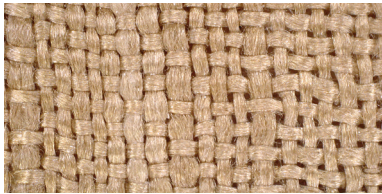
안감 | 주