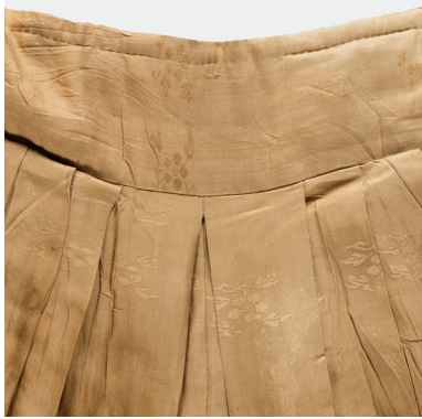
바지 주름 모습