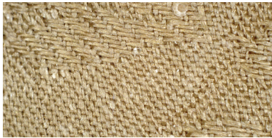
겉감 | 문능