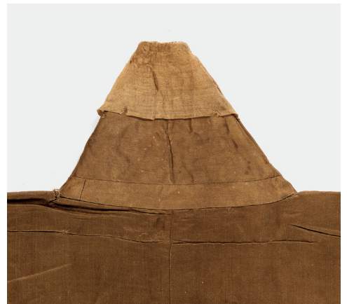
고대 아래 줄임