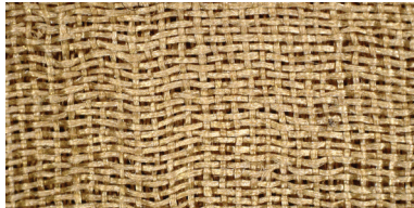
동정 | 주