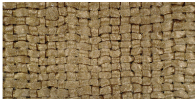
안감 | 주